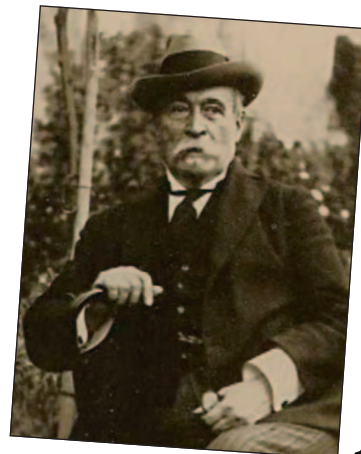
Victoria, 1880 Palazzo della Provincia, Reggio Calabria; nel riquadro L'azione, 1911 Altare della patria, Roma in alto l'artista; pagina destra in alto Fanciullo con angelo, 1900 Cappella Greco, Cosenza; nel riquadro Fiorita, 1891, Museo Filangieri, Napoli

Personaggi reali, figure tratte dalla letteratura (soprattutto dalle commedie di Alfred de Musset) e immagini simboliche costituiscono un vasto reper-